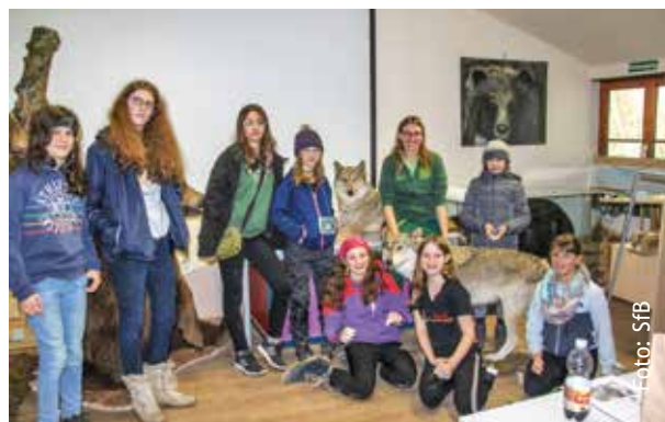
Sprachkurs der anderen Art

Liebe Tierpatinnen und Tierpaten, die Einladungen für den 13.9.2020 werden natürlich auch direkt an Euch versandt.