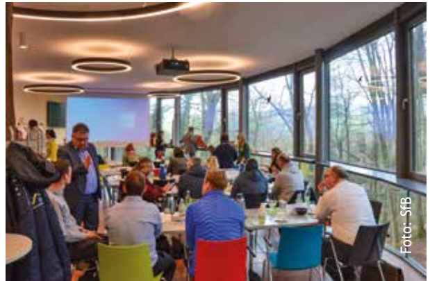
Veranstaltung mit Panoramablick auf den Bärenwald