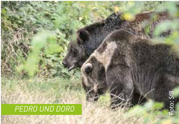
PEDRO UND DORO