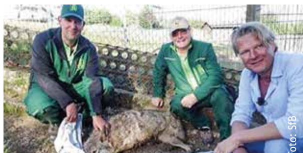
Gemeinsam mit hundkatzemaus konnte ein ganzes Wolfsrudel gerettet werden

33 Bären, 36 Wölfe und 3 Luchse wurden gerettet und in ihren naturnahen Freianlagen untergebracht. Weitere Tiere konnten in Kooperation mit anderen Einrichtungen untergebracht werden.