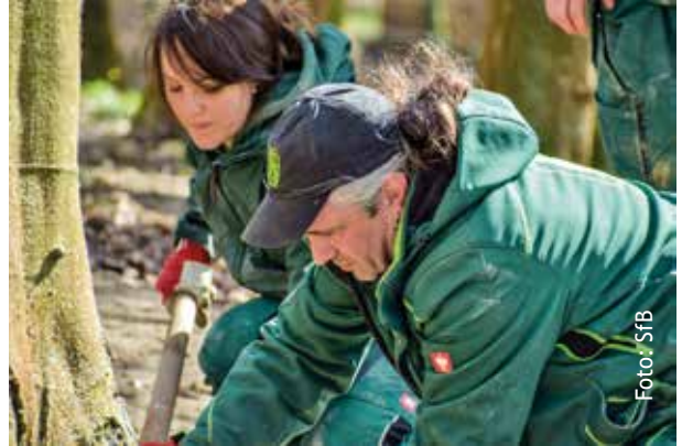
Einsatz in den Anlagen

Wer Interesse hat, sich mit in das gerade entstehende Netzwerk einzuklinken, kann gerne an worbis@baer.de schreiben