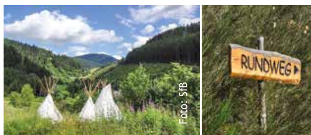
Ferien im Freien

Anmeldung unter schwarzwald@baer.de oder telefonisch unter 07839 910380