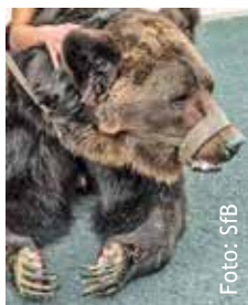
Lebensverachtende Praktiken der Tiershows

Es vergehen Jahre in denen nichts geschieht, dafür kursieren aber immer wieder Horrorvideos von dem Schaustellerpaar und ihren Bären. Und es wird noch schlimmer: es handelt sich nicht nur um einen, sondern um insgesamt drei Bären!