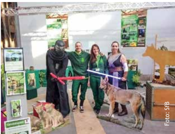
Möge die Macht der Bären mit uns sein

Dabei erfahren die Kinder und Jugendlichen nicht nur spannende Informationen über Bär, Luchs und Wolf, sondern auch über Nutztiere, das Ökosystem Wald oder die Welt der Insekten. Spielerisch und abwechslungsreich wird beispielsweise erforscht, wieso für Hunde Körpersprache viel wichtiger ist als Worte oder warum Nutztiere ein wertvolles Sicherheitskommando für uns darstellen. Außerdem sind zahlreiche weitere Neuerungen geplant, die mit Hilfe des gesamten Teams umgesetzt werden sollen. Dazu gehört beispielsweise die Aufbereitung der Beschilderung, pädagogischer Elemente und die Planung spannender Workshops und Events.