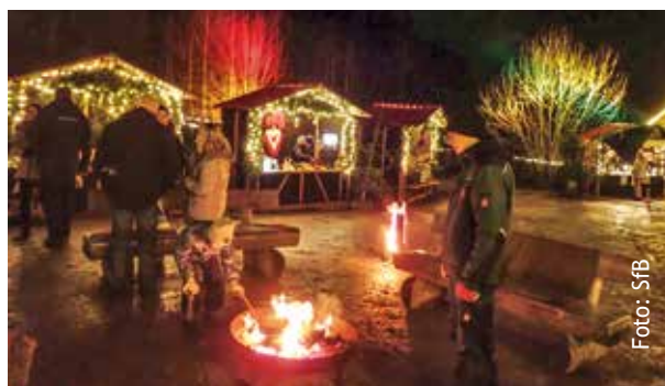
Mehr als ein Weihnachtsmarkt: die Bärenweihnacht

Wir bedanken uns bei allen ehrenamtlichen Helferinnen und Helfern, die mit Ihrem Einsatz dazu beigetragen haben, dass dieses Wochenende am dritten Advent ganz besonders BÄRSinnlich war!