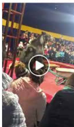
Die Videos der Auftritte schockierten uns

Frankreich 2015: wir erhalten schockierendes Filmmaterial. Darauf ist ein männlicher Bär zu sehen, der mit Maulkorb, Longe und Kettenhalsband drangsaliert wird um Kunststücke aufzuführen. Schnell wird klar, dass seine Hinterhand versteift ist. Ein typisches Anzeichen von Arthrose, eine Folge von jahrelanger schlechter Haltung. Das Tier wirkt unterwürfig, verängstigt. Dies erreicht man bei einem Bären nur dadurch, indem man ihn bereits im Welpenalter bricht und ihm vom Menschen abhängig macht.