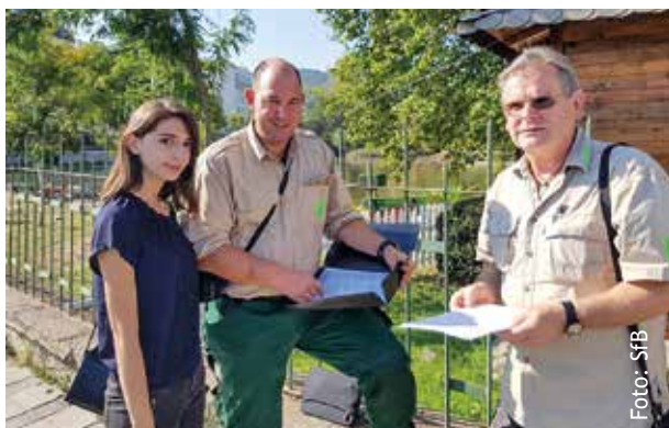
Europaweit im Einsatz für die Wildtiere