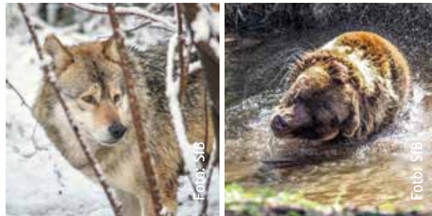
Zehn Jahre im Zeichen von Wolf, Luchs und Bär

Ein ganzes Jahrzehnt Tierschutz im Schwarzwald - wir sagen Danke! Am 12.9. laden wir Groß und Klein ganz herzlich zu uns ins Schwarzwälder Projekt ein, um gemeinsam 10 Jahre Tierschutz zu feiern.