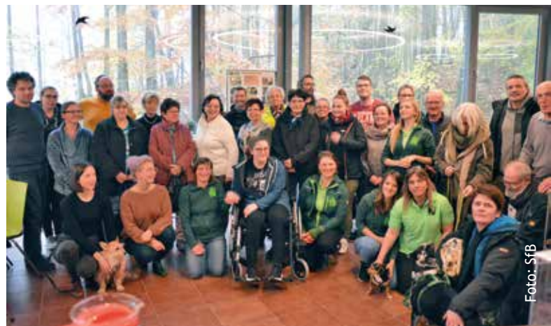
Thüringens Tierschützer vereint euch!

Ihr Verein ist noch nicht mit dabei? Kein Problem! Schreiben Sie uns einfach an worbis@baer.de oder rufen Sie direkt durch: 03607 20090